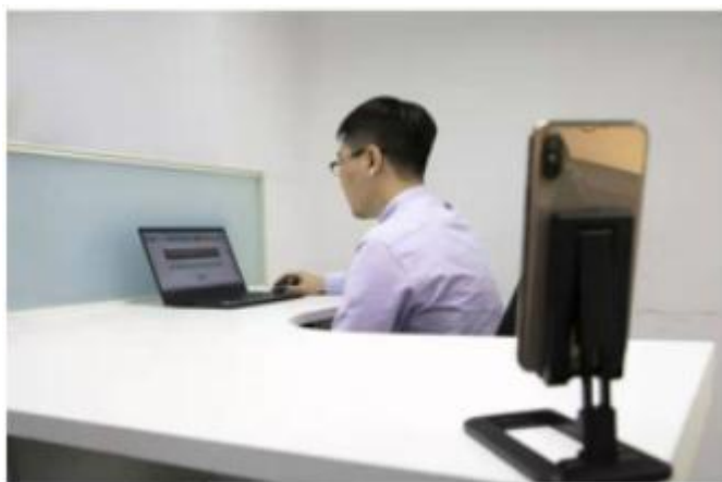
答题电脑、监管手机摆放图示

比赛开始前每一位参赛选手准备一台电脑（摄像头、麦克风可正常使用），登录比赛系统参赛答题，开启音频及视频，确保参赛人员完全展现、比赛全程不离开，便于线上观众观摩；用另外一台手机置于身体侧后方，通过第三方软件（腾讯会议），开启音频及视频，展示本人及答题电脑全貌，以便公正监管。